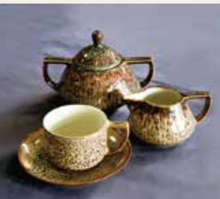
水の平焼五代岡部源四郎作の「赤海鼠コーヒーセット」