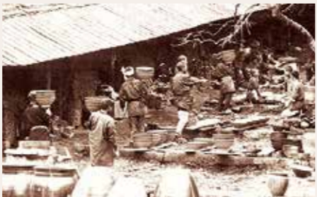
水の平焼登り窯での作業風景(明治40年頃)