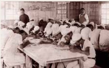
天草中学窯業部の実習風景