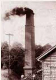
天草中学窯業部大煙突

心の安定のために設けられた天草の四ヶ本寺の一つです。境内には民吉が天中を訪ねて来たときの様子を記した碑があります。